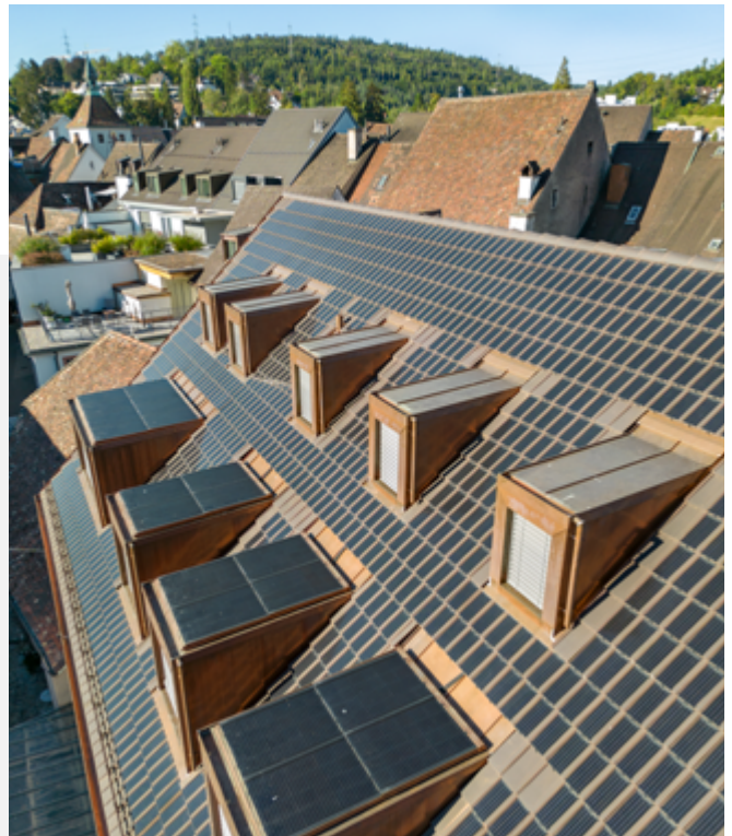
Auf den handelsüblichen Tondachziegeln sind kleine Photovoltaikmodule befestigt. So lassen sich Energieproduktion und Ästhetik in Einklang bringen.

Ein Augenmerk bei der Erneuerung lag auf einer möglichst umweltschonenden Energieversorgung. Dazu planten die Projektverantwortlichen auf dem Dach des Gebäudes eine Photovoltaikanlage, um selbst Strom zu erzeugen und beispielsweise für das Aufladen von Elektrofahrzeugen einsetzen zu können. Die Herausforderung dabei: Eine Solaranlage muss den Anforderungen des Raumplanungsgesetzes genügen. Im Fall der Altstadt von Liestal bedeutet das konkret, dass eine Solaranlage nur wenig reflektieren und nicht über das Dach hinausragen oder von der Strasse aus einsehbar sein darf.