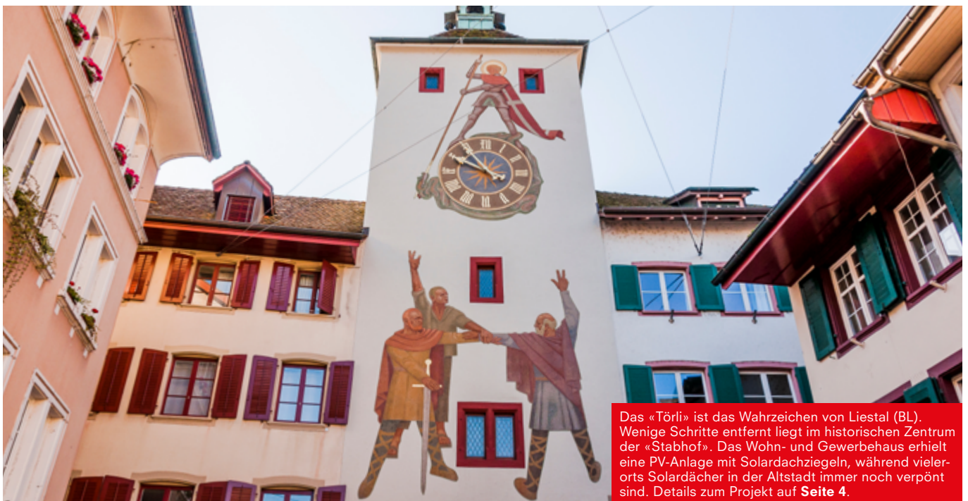
Das «Törli» ist das Wahrzeichen von Liestal (BL). Wenige Schritte entfernt liegt im historischen Zentrum der «Stabhof». Das Wohn- und Gewerbehaus erhielt eine PV-Anlage mit Solardachziegeln, während vielerorts Solardächer in der Altstadt immer noch verpönt sind. Details zum Projekt auf Seite 4 .

Wer ein nachhaltiges Gebäude bauen will, muss ein Augenmerk auf die Materialwahl legen. Gefragt sind Baustoffe, die nebst den funktionalen Kriterien auch die Ansprüche von Wirtschaft, Gesellschaft und Umwelt erfüllen. Die Hersteller von Schweizer Tonbaustoffen berücksichtigen diese Aspekte: Sie schaffen regionale Wertschöpfung und Arbeitsplätze, pflegen einen schonenden Umgang mit den Ressourcen und fördern die Innovation am Werkplatz Schweiz. Kurzum: Sie sind gut für die Heimat.