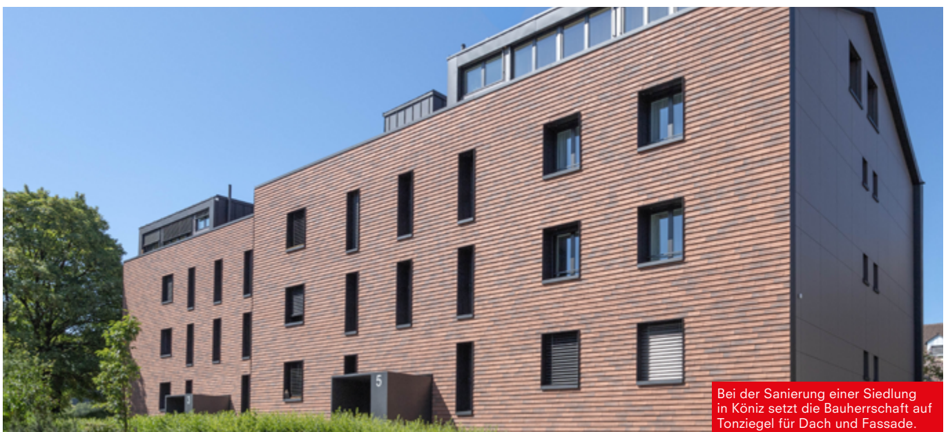
Bei der Sanierung einer Siedlung in Köniz setzt die Bauherrschaft auf Tonziegel für Dach und Fassade.

Für die Ökobilanz eines Gebäudes sind nicht nur die Emissionen aus der Erstellungsphase relevant, sondern auch diejenigen aus Unterhalt, Ersatz und Wartung. Über den gesamten Lebenszyklus betrachtet, macht die Nutzung 80 Prozent der Emissionen aus. Um ein klimaverträgliches Gebäude zu bauen, sollte man deshalb auf Materialien setzen, die eine ähnlich lange Lebensdauer haben wie die Primärstruktur – also 80 und mehr Jahre. Dieses Alter erreicht eine Gebäudehülle aus Sichtbackstein, Tondachziegeln oder -fassadenplatten.