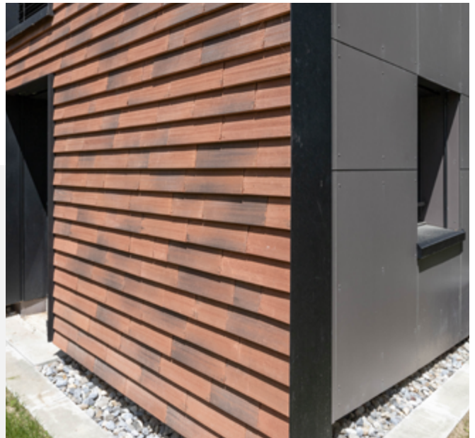
Wie ein Mantel legen sich die Tonziegel über das Dach und die Fassade der sanierten Gebäude der Siedlung Mösliweg in Köniz, BE.

Von dieser attraktiven Wohnlage profitieren auch die Bewohnerinnen und Bewohner einer Siedlung am Mösliweg, der den westlichen Abschluss des Quartiers bildet. Die drei Mehrfamilienhäuser aus den frühen 1980er-Jahren werden seit 2022 in mehreren Etappen umfassend saniert und ausgebaut. Nach Abschluss der Erneuerung wird die Siedlung insgesamt 51 Wohnungen zwischen 1,5 und 5,5 Zimmern umfassen. Der Wohnkomfort wird durch die Umbaumaassnahmen deutlich gesteigert: Neu verfügen zum Beispiel sämtliche Wohnungen über einen Bodenbelag aus Eichenparkett sowie einen grosszügigen Balkon oder Sitzplatz.