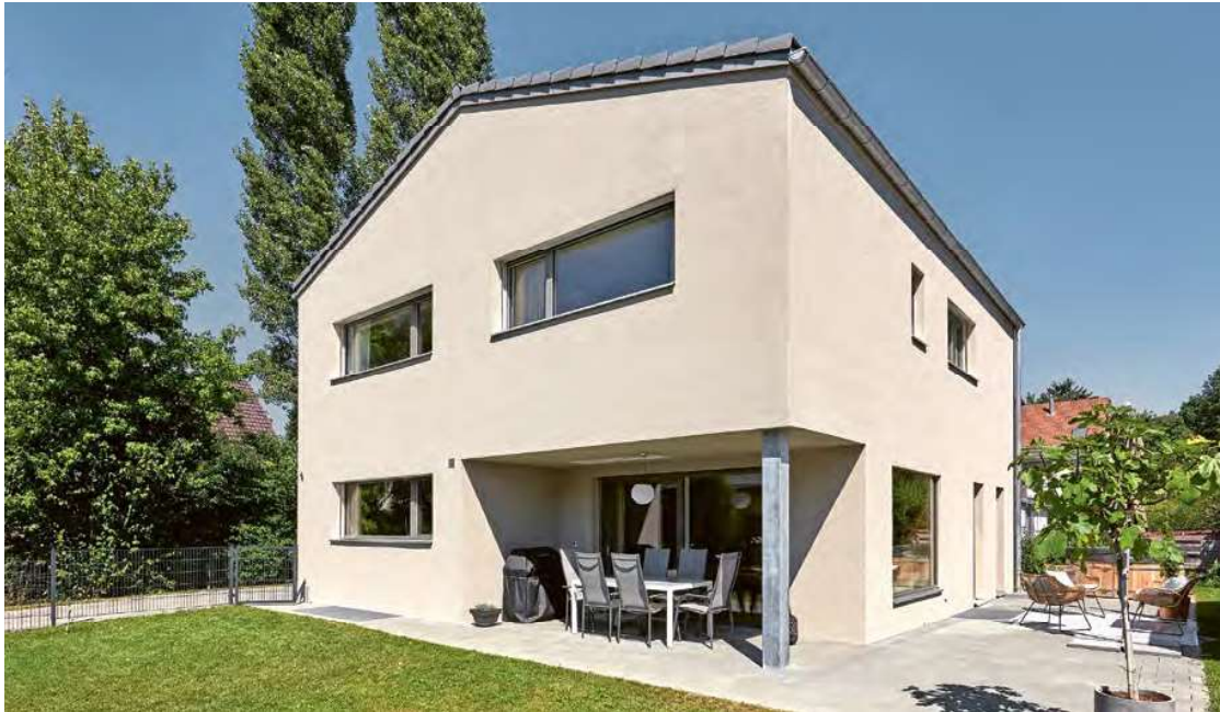
Individuelles Einfamilienhaus mit Einsteinmauerwerk. Bauzeit: 9 Monate.