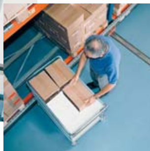
Bild 11 Machen Sie beim Umladen von Lasten von einer Seite auf die andere immer einen Zwischenschritt.