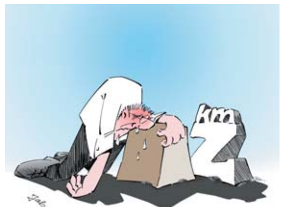
Bild 16 Auf langen Transportwegen können scheinbar leichte Gewichte ganz schön schwer werden! Deshalb sind bei langen Wegen immer Abstriche beim Gewicht zu machen. Muss man beispielsweise eine Last 20 m weit tragen, nimmt man nur noch die Hälfte dessen, was man sich sonst auf einer Kurzdistanz von 2 m zugemutet hätte. Lässt sich die Last nicht teilen, so sollten Sie ein Transporthilfsmittel benutzen.