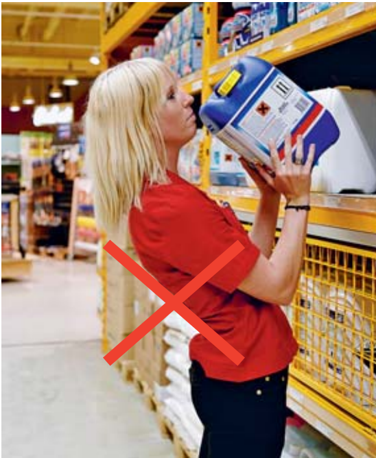
Bild 9 Hohlkreuz vermeiden. Die Tendenz dazu besteht vor allem, wenn die Ablagefläche hoch ist (Steighilfe benutzen).