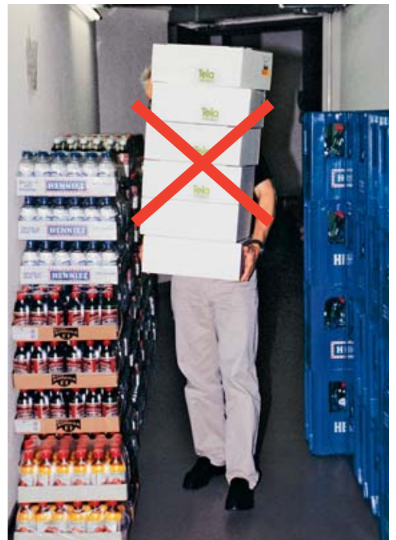
Bild 12 Oft werden Pakete aufeinander gestapelt und versperren die Sicht. Wenn es dann im «Blindflug» noch Treppen rauf und runter geht, wird's gefährlich. Also: Auf gute Sicht achten!