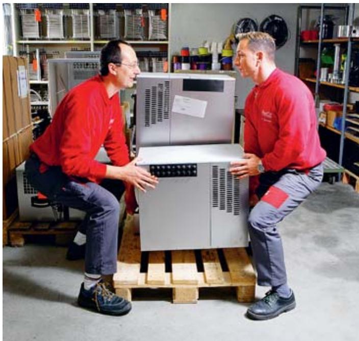
Bild 15 Zu zweit geht's besser.