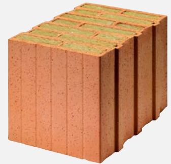
Brique grand format avec matériau isolant d'origine minérale

Les briques grand format sont des briques alvéolaires avec des parois en argile, dont les pores fins garantissent une isolation thermique élevée. Lorsque les alvéoles sont remplies de matériaux isolants d'origine minérale ou de la laine de mouton, la qualité d'isolation est encore meilleure. Mais l'argile stocke également la chaleur. Les briques grand format permettent de dresser des murs extérieurs monolithiques, qui ne requièrent aucune isolation supplémentaire. Comme toutes les briques, elles sont naturellement esthétiques, apportent une isolation thermique et acoustique de qualité et ont une excellente influence sur le climat intérieur. De plus, leur fabrication est économe en ressources et elles sont durables, car les trajets de livraison sont courts, leur durée de vie est longue et leur utilisation en tant que matière première est prometteuse.